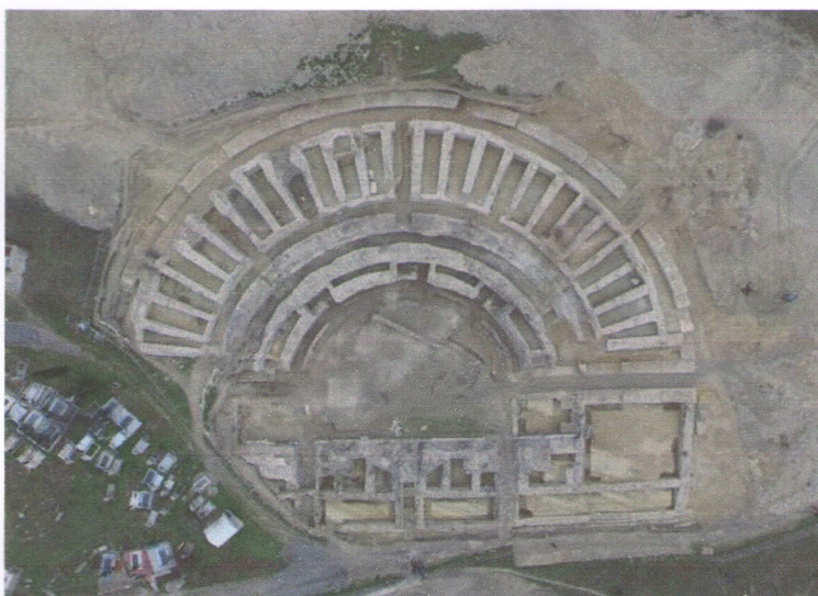
Панорама на тетарот во Скупи