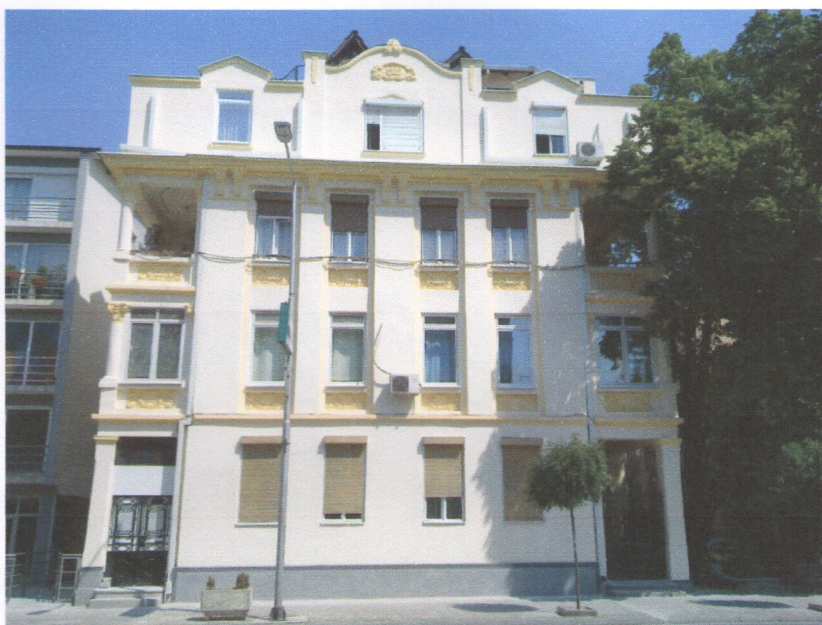
ул. „Илинденска,, бр. 68