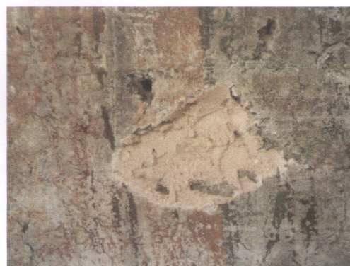
Детали од фрески во фаза на конзервација (китирање).