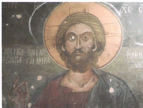
Детали од фрески во фаза на конзервација (одстранување на боја)