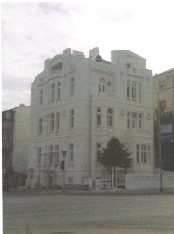
ул.,Илинденска,, бр. 80