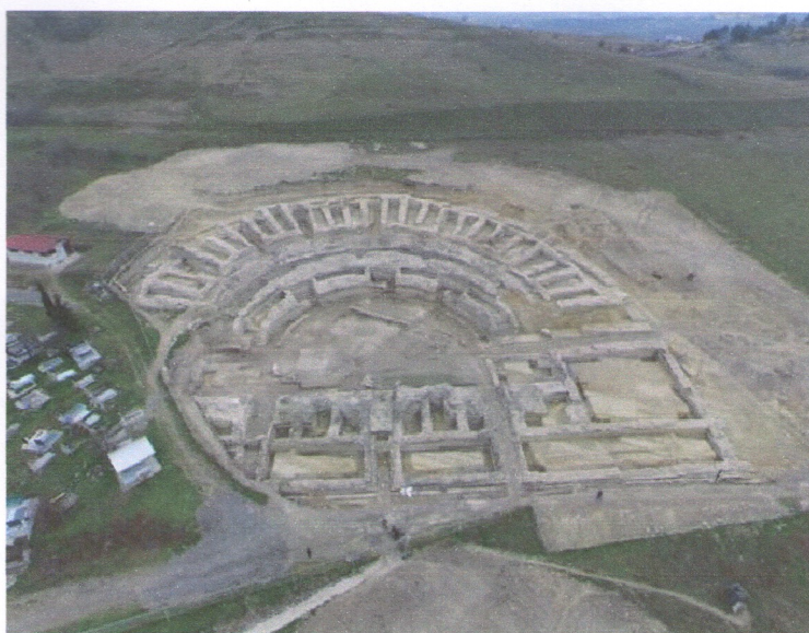
Панорама на тетарот во Скупи